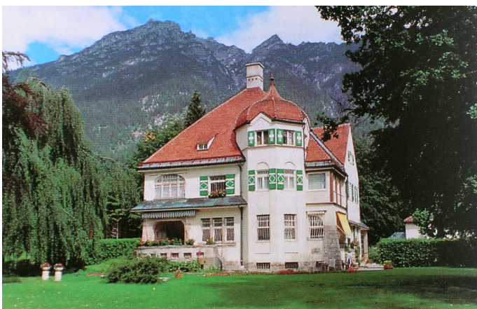
Strauss villa i Garmisch

Strauss som tidigare under sitt liv varit en viktig figur för att utveckla musiken i en modernare riktning gör här inget försök att luckra upp tonaliteten med atonala inslag. Det blir som en nostalgisk fridfull tillbakablick på ett enklare liv. Kanske hoppfullt naivt och vackert i en tid som genomlevde ett av vår historias mest fasansfulla skeden.